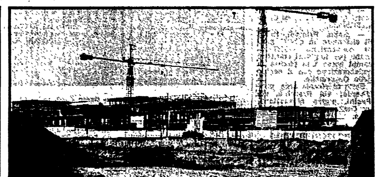
Un quartiere moderno. Quello di Tor Bella Monaca è il primo quartiere nella storia di Roma che il Comune costruisce con tutti i servizi. Non solo le case, come a Spinetto, di Laurentino, a Casal de' Pazzi. Ma tutto ciò che serve a un quartiere con diecimila abitanti. A Tor Bella Monaca, infatti, saranno costruiti 3.362 appartamenti dei quali 2.800 previsti coi fondi della legge 25 (dei restanti, 560 sono a Rebibbia, 183 a Pietralata). Il Comune ha messo a disposizione 42 miliardi del proprio bilancio per completare le opere di urbanizzazione. Il TAR (il Tribunale amministrativo del Lazio), per la verità, ha con una discutibile sentenza bloccato momentaneamente i lavori, ma si tratta di una decisione che con ogni probabilità sarà rivista.

Le assegnazioni saranno fatte con criteri rigorosi e trasparenti, nell'ordine in cui sono elencate nel bando. Nell'ambito di ciascuna categoria la precedenza sarà data agli anziani (a cui sono riservati non oltre 400 appartamenti) e alle famiglie con il reddito più basso. Per l'ammissione al concorso bisogna avere naturalmente la residenza a Roma, non disporre di un alloggio idoneo in città o in qualsiasi comune vicino, non avere già ottenuto una casa di edilizia residenziale pubblica. La domanda può essere presentata in circoscrizione da lunedì. Oltre ai certificati necessari per ogni categoria, bisognerà allegare il modello della dichiarazione dei redditi relativi al 1980.