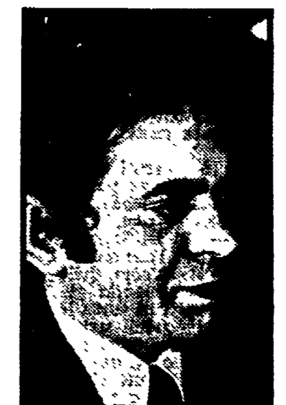
Publici? «La situazione, a dir poco, era disastrosa. Vecchio, indagato rispetto ai problemi della provincia. Il personale poi era avvilito; gli ingegneri, gli architetti, i tecnici, praticamente avevano le mani legate, erano tanta professionalità spreco. Ci si occupava solo della viabilità, ed anche in quel campo con interventi sporadici, senza programmi, spesso con logiche puramente clientelari».

«Le mie debolezze? Non so... Gli amici mi criticano perché alle volte corro poco, i colleghi, i politici perché non mi reclamizzo».