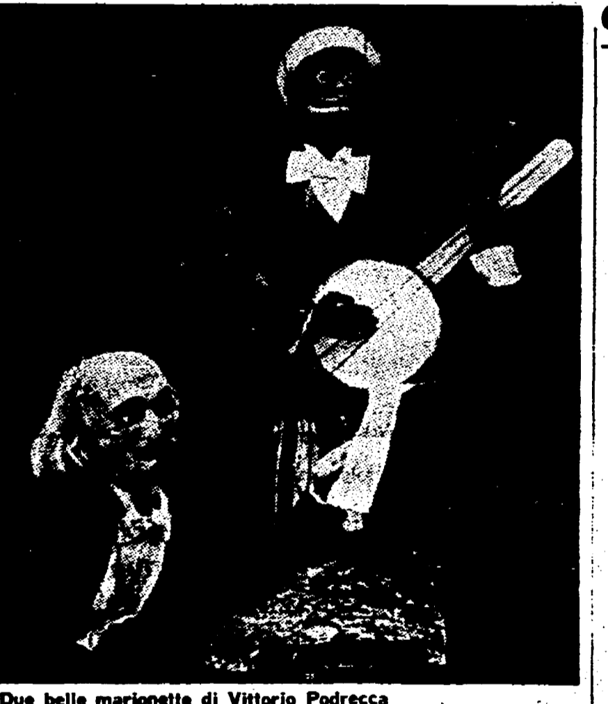
Due belle marionette di Vittorio Podrecca

Oillo, Josephine Baker e Greta Garbo, oggi le Marionette presentano, invece, uno spettacolo che scarta l'attualità e predilige le sempre irresistibili macchiette di personaggi-ipo.