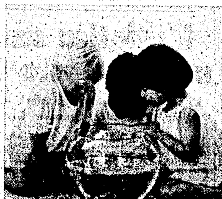
Acque vive e di nuovo pulite, questo è il nostro impegno.

Anche efficienti impianti di depurazione fanno parte dell'affidabilità Hoechst Italia.