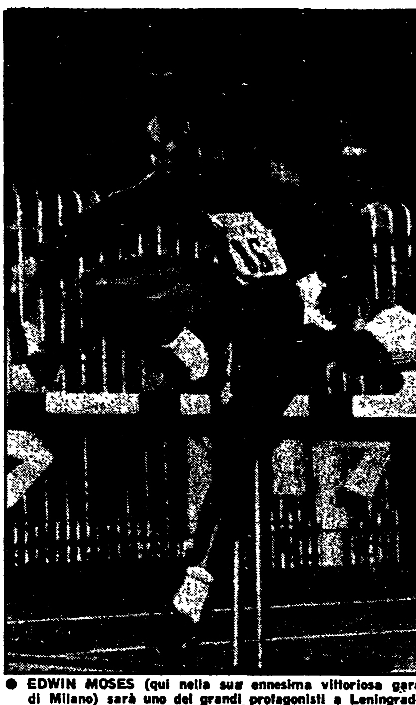
EDWIN MOSES (qui nella sua ennesima vittoriosa gara di Milano) sarà uno dei grandi protagonisti a Leningrado

«Notte delle stelle» è servita al ventimila dell'Arena per applaudire il grande mezzofondista inglese Steve Ovett. Il campione olimpico ha vinto il 1500 metri mancando il suo limite mondiale di 59 centesimi.