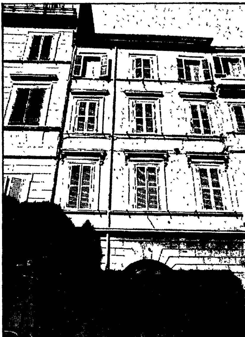
«Andargli dietro». Tutti gli appartamenti di proprietà pubblica devono essere rigorosamente destinati all'uso per il quale sono stati costruiti e catalogati. Inoltre la proprietà, gli enti, le banche, le Ipa devono essere obbligati ad eseguire regolarmente la manutenzione degli stabili senza aspettare che una volta in rovina siano abbandonati dagli stessi inquilini.

1. Comune e circoscrizione devono pretendere che i restauri conservativi non trasformino le abitazioni e le botteghe artigiane in uffici e magazzini di grandi ditte, pena la decadenza della concessione.