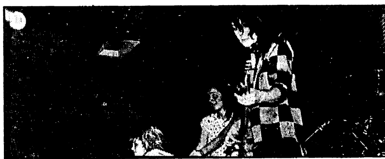
Il gruppo delle «Slits» durante l'esibizione al Piper nell'aprile dell'80

L'hanno relegato ai margini, come ormai non eravamo più abituati a vederlo. Dopo il «boom» dell'anno scorso (100 mila presenze alla rassegna di Castel Sant'Angelo) quest'estate il rock ha trovato poco credito.