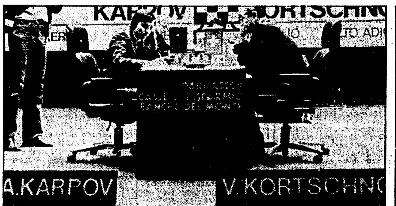
Come Karpov ha vinto la prima, brutta partita