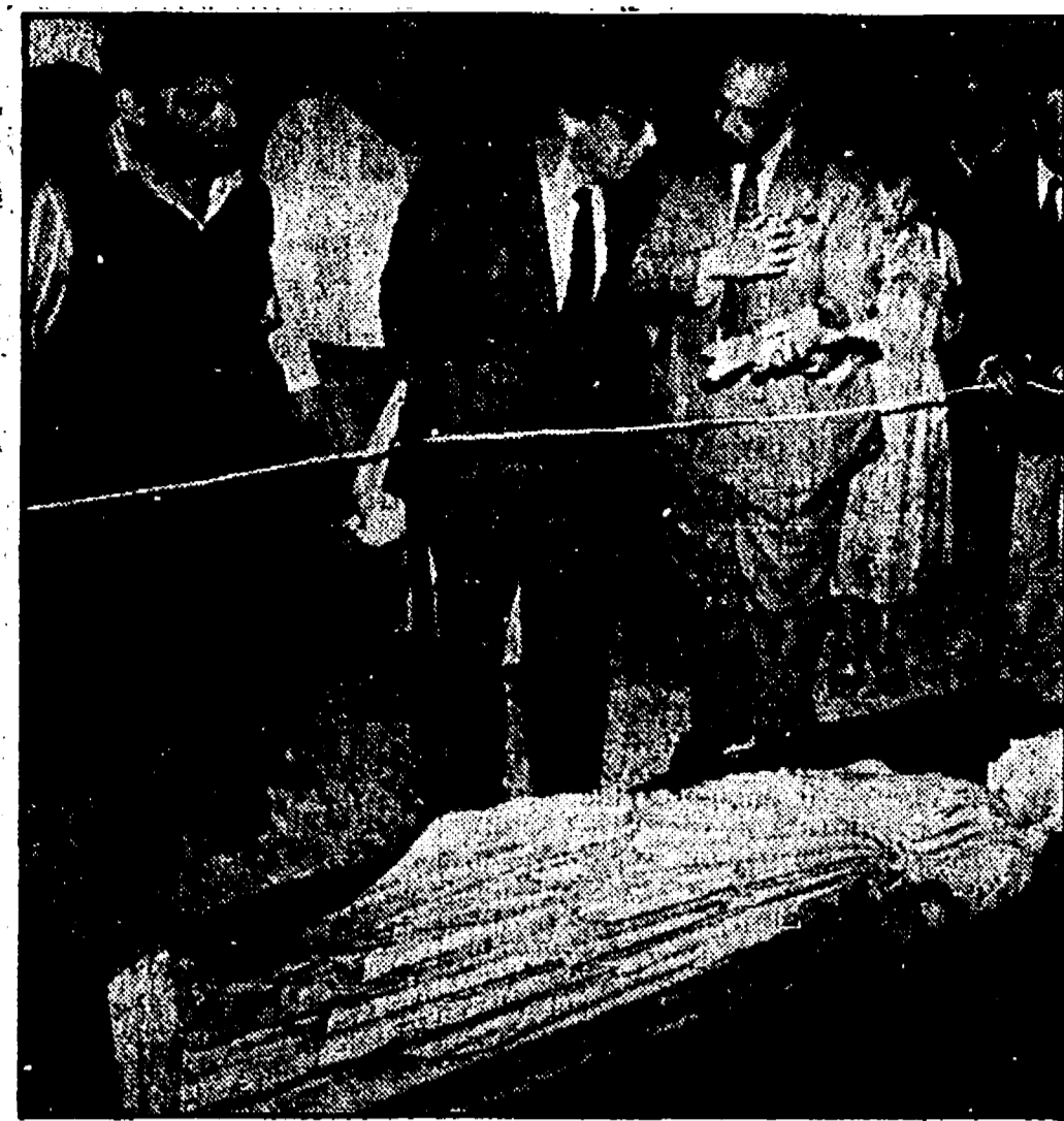
BAIA (Napoli) — L'ultima statua trovata nei fondali della zona