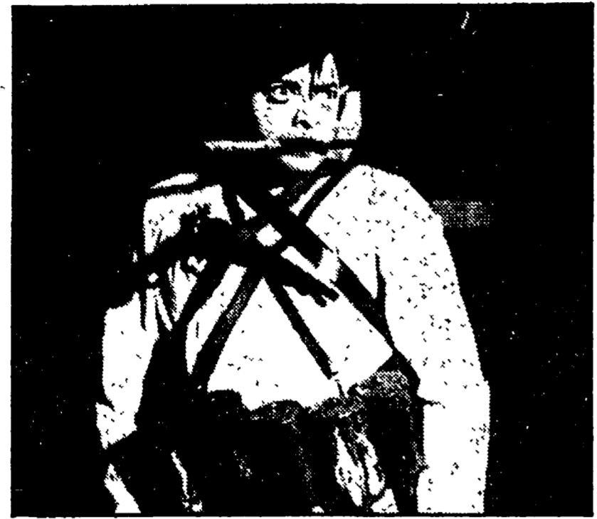
Peter Lorre, interprete brechtiano nel 1931