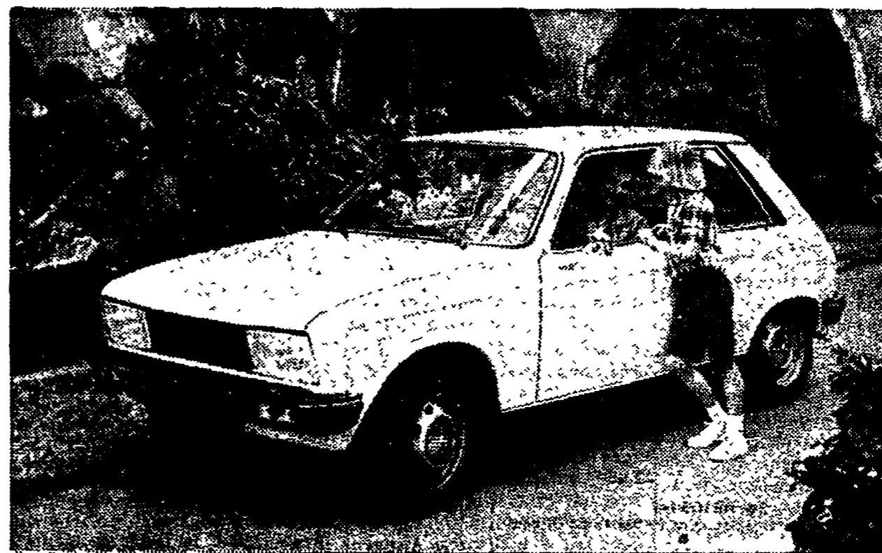
Nella foto: la nuova Peugeot 104 messa in palio tra tutti i visitatori