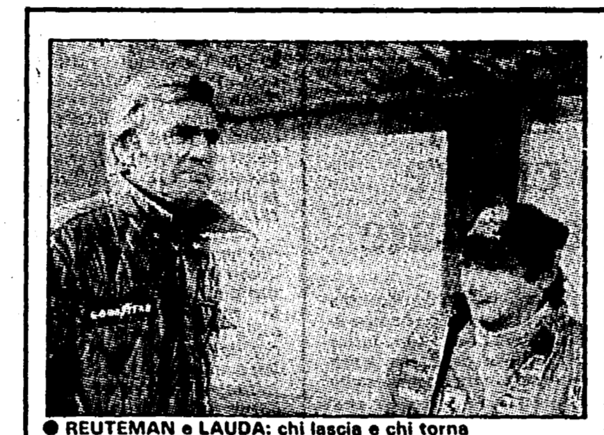
REUTEMAN e LAUDA: chi lascia e chi torna

BUDAPEST — L'Ungheria si è matematicamente qualificata per i campionati mondiali battendo la Norvegia 4-1 (1-1) in un incontro del girone 4 della zona europea delle eliminatorie. I gol sono stati realizzati da Balut, Kriss (2) Fazekas e per l'Ungheria è Lund per la Norvegia. Gli incontri: Svizzera-Romania dell'11 novembre e Inghilterra-Ungheria del 18 definiranno la seconda finalista.