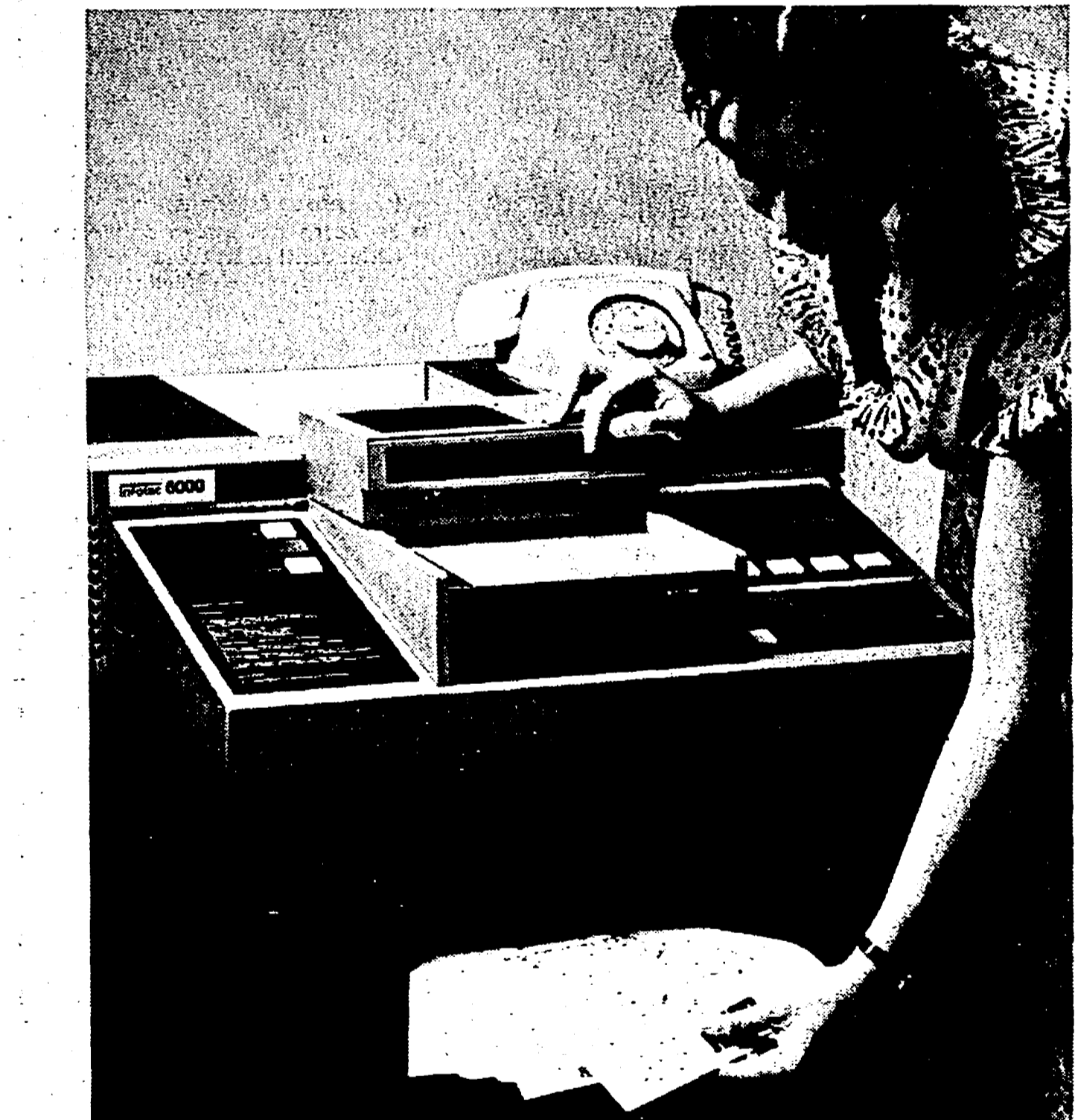
Ricetrasmittente Telefax della Kalle Infotec. per la trasmissione di disegni e documenti a mezzo telefono.

Sempre ieri, un'altra agenzia sottolineava che l'ENEL ha inviato agli utenti una «letterina» per far accettare preventivamente l'aumento; l'ente elettrico esorta peraltro gli abbonati a partecipare alla campagna di risparmio. Turni di emergenza e ipotetici black-out si rinfacciano, intanto, alla soglia dell'inverno: a partire da lunedì 16 in tutti i quartieri e in tutte le città sarà bene leggere attentamente i manifesti che indicano i relativi turni di rischio. Intanto, l'altro ieri il presidente dell'Enel, Corbellini, ha smentito le voci di sue imminenti dimissioni. Resterà al mio posto — ha detto in un'intervista — fino a che non avrò portato a termine gli impegni per i quali ho accettato questo incarico: la costruzione delle centrali nucleari e a carbone, l'avvio del piano energetico. Se qualcun altro la pensa diversamente, aggiunga significativamente Corbellini, lo dica.