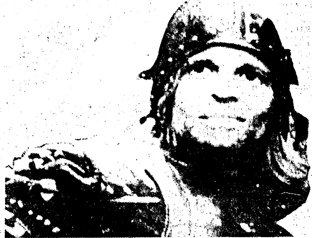
Klaus Kinski in «Aguirre, furore di Dios», del regista tedesco Werner Herzog (1972).

de il fiume fino a toccare il Mar del Brasile, risalire in Venezuela e di qui tornare in Perù.