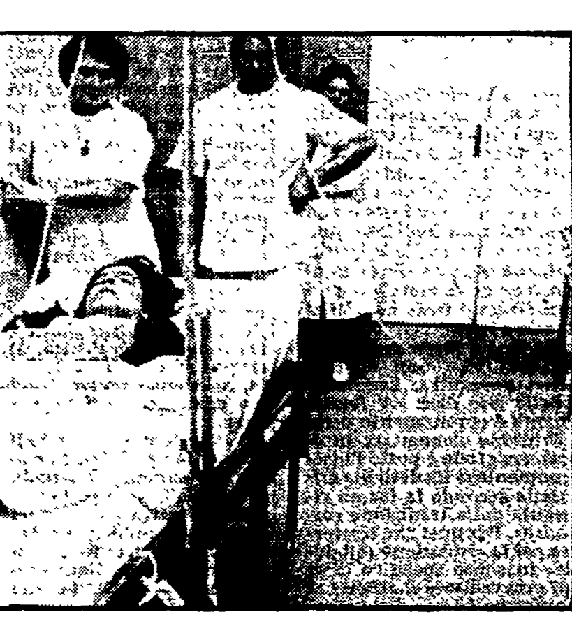
NAPOLI — Una giovane finita nella sala di rianimazione