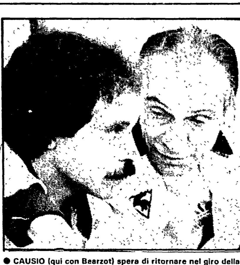
CAUSIO (qui con Bearzot) spera di ritornare nel giro della nazionale. Ci riuscirà?