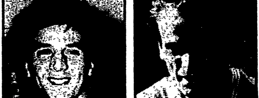
MILANO - Sul campionato di calcio s'è abbattuto il pugno duro del giudice sportivo avvocato Barbè. Nel suo bollettino una valanga di squalifiche.

Dalla redazione FIRENZE - «È una partita troppo importante. Non posso sbagliare alcuna mossa. Per questo la formazione la renderò nota solo poco prima della gara. L'Inter è squadra al massimo della concentrazione...»