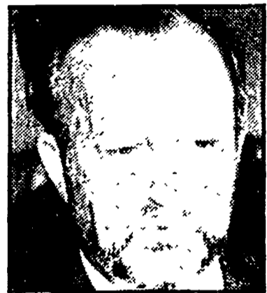
Charles Hernu, ministro francese della Difesa

Va avanti il disegno mitterrandiano di liberare i paesi di nuova indipendenza dai vincoli con Usa e Urss