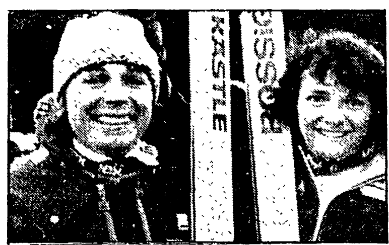
La EPPLE e la SORENSEN sono le grandi favorite