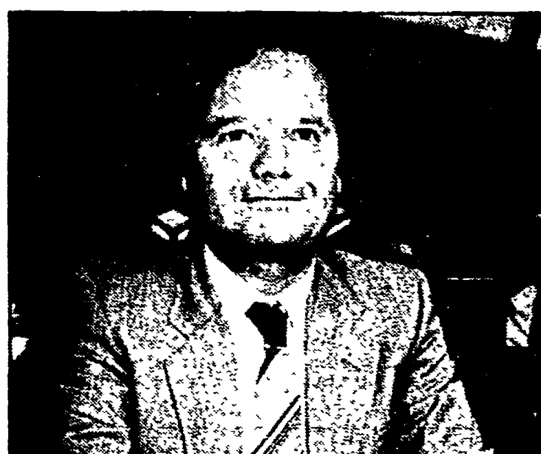
Il presidente della Regione Santarelli

La vicenda merita qualche commento e un paio di domande. Quanto durerà ancora questo spettacolo di contrasti aperti tra il presidente della Regione e l'assessore alla sanità? La conseguenza di tutto ciò è che, a dispetto delle USL, sono pressate dai sindacati che rivendicano — non si vede perché non dovrebbero farlo — l'applicazio-