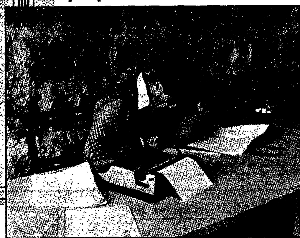
La nuova copertina di «Nuovi argomenti», e una delle ultime foto di Pasolini al suo tavolo di lavoro pubblicate dalla rivista

Moravia, Sciascia e Siciliano hanno presentato la terza serie della prestigiosa rivista «Giornali e politica non hanno più idee: solo la letteratura può parlare della realtà»