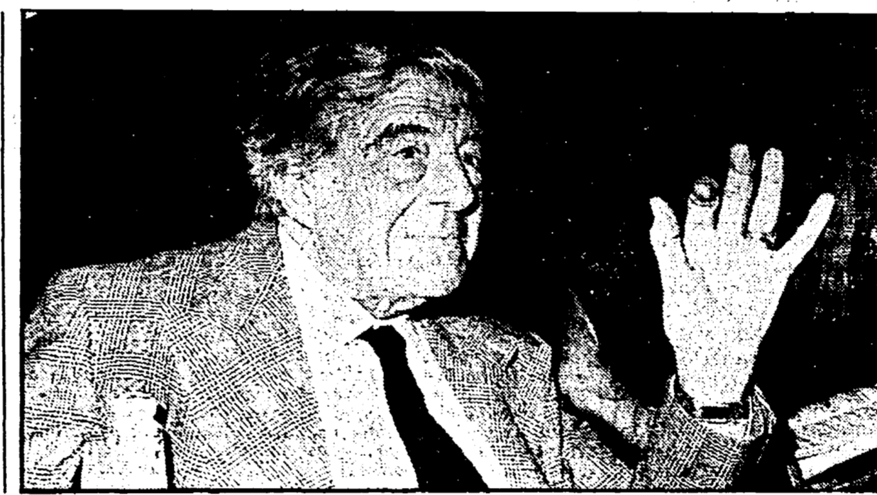
NELLA FOTO: il maestro De Fabritiis

Il maestro Oliviero De Fabritiis compie ottanta anni, e il Teatro dell'Opera festeggia questo compleanno, affidando all'illustre direttore d'orchestra la Sonnambula di Vincenzo Bellini. La «prima» è fissata per domani sera, alle ore 20.30.