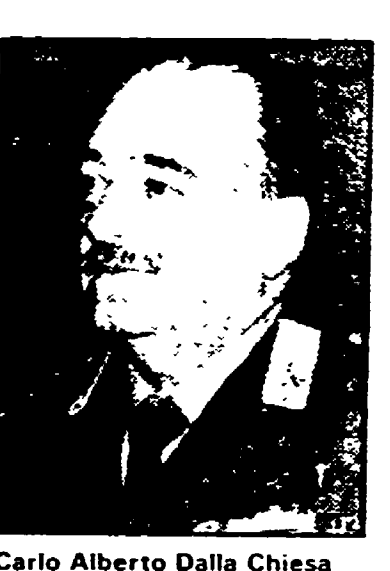
Carlo Alberto Dalla Chiesa

Non è un «incarico speciale» - I suoi successi contro le bande terroristiche