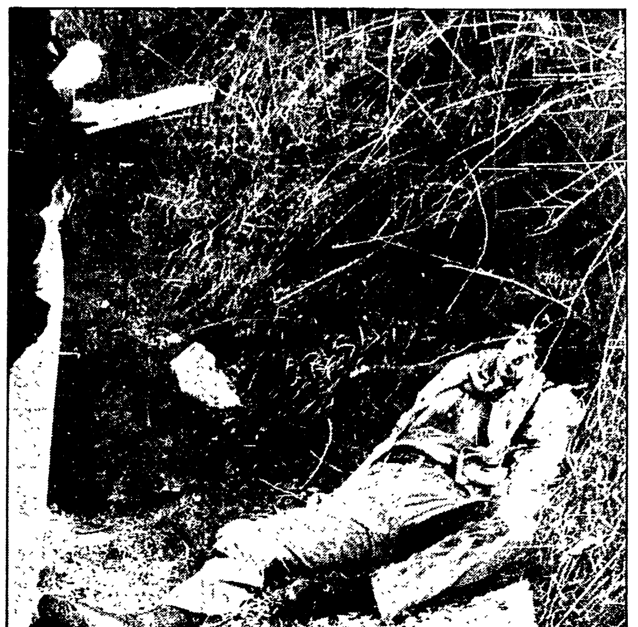
NAPOLI — Uno dei cadaveri ritrovati nelle campagne di Villaricca