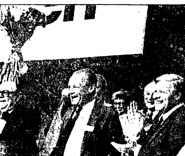
MONACO — Willy Brandt e Helmut Schmidt durante il congresso della SPD

«Né due giorni seguiti alla relazione di Brandt e al discorso di Schmidt, mercoledì e venerdì, i due delegati hanno discusso di politica sociale e di disarmo... «Per due giorni seguiti alla relazione di Brandt e al discorso di Schmidt, mercoledì e venerdì, i due delegati hanno discusso di politica sociale e di disarmo...»