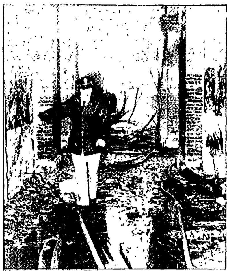
TODI — L'interno del pianoterra del palazzo dopo lo spaventoso incendio