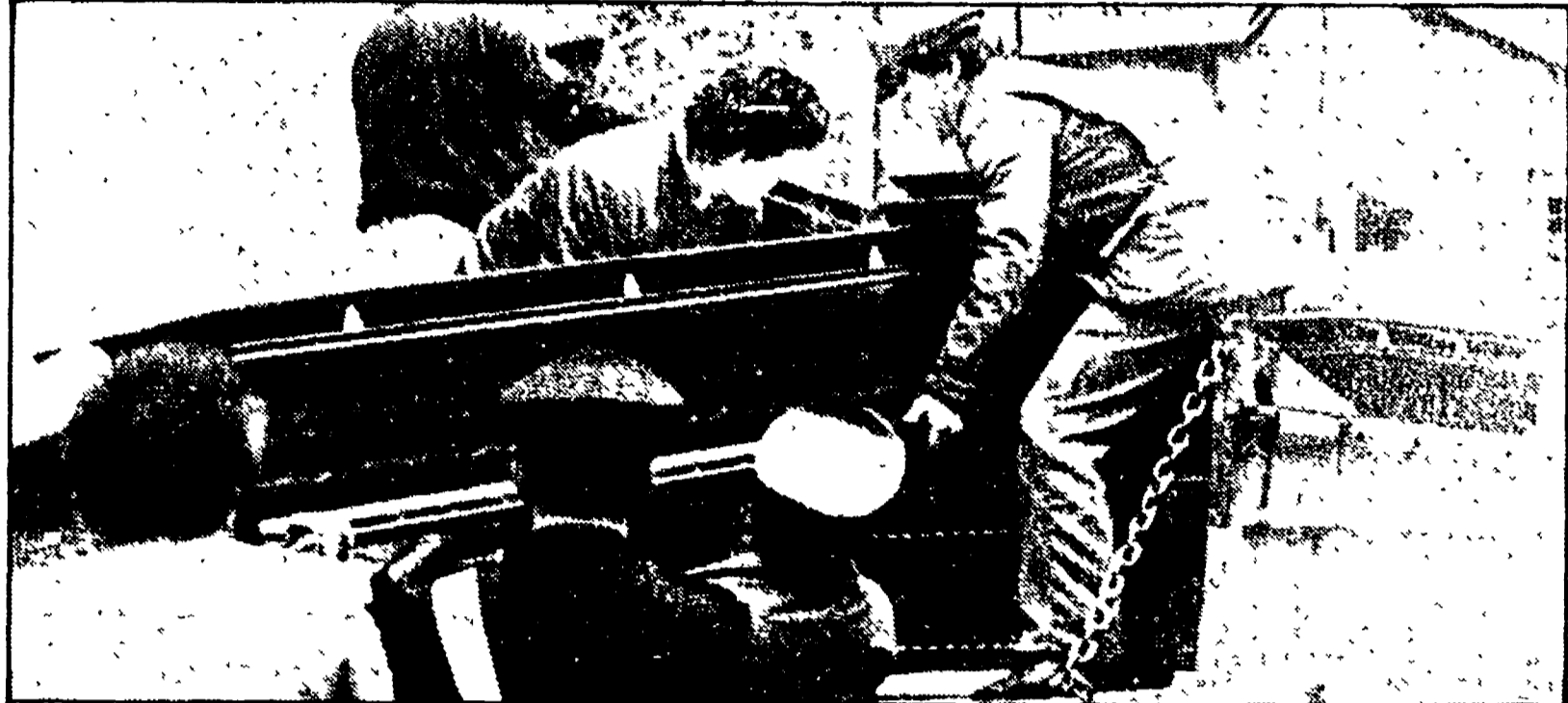
TODI — L'arrivo delle bare per la raccolta dei corpi