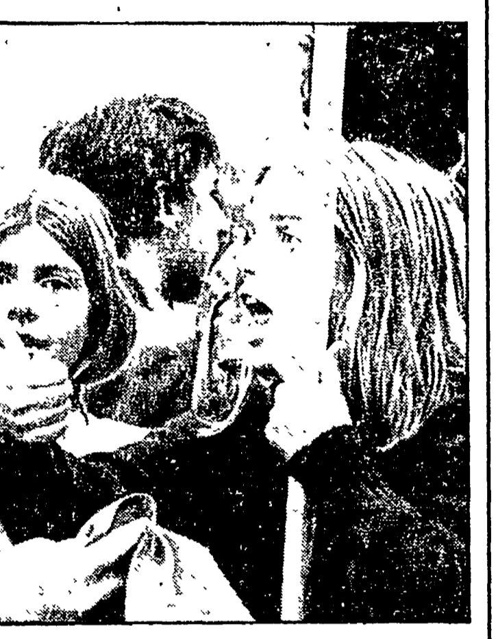
Oggi alle 17, un appuntamento organizzato dalla FGCI, con alcuni intellettuali. Verso il XXI Congresso nazionale