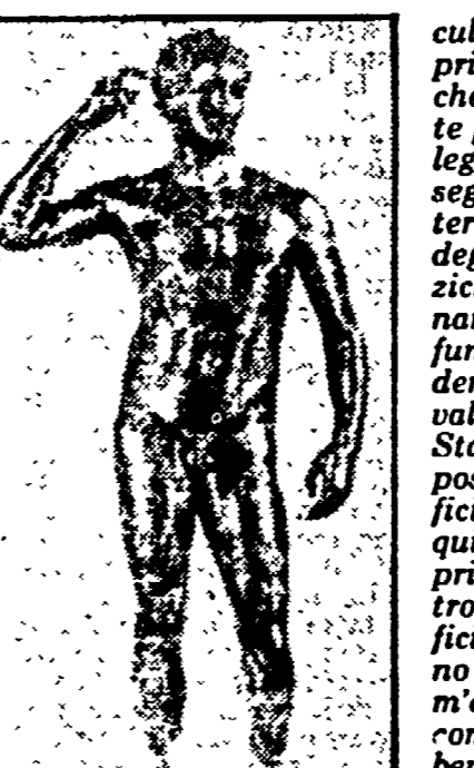
Lisippo (?) o anonimo greco del IV sec. a.C.: «Giovane atleta che s'incorona».