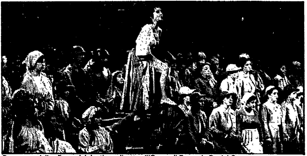
Due scene della «Forza del destino» diretta all'Opera di Roma da Daniel Oren

«Sulla strada» dei Magazzini Criminali a Scandicci