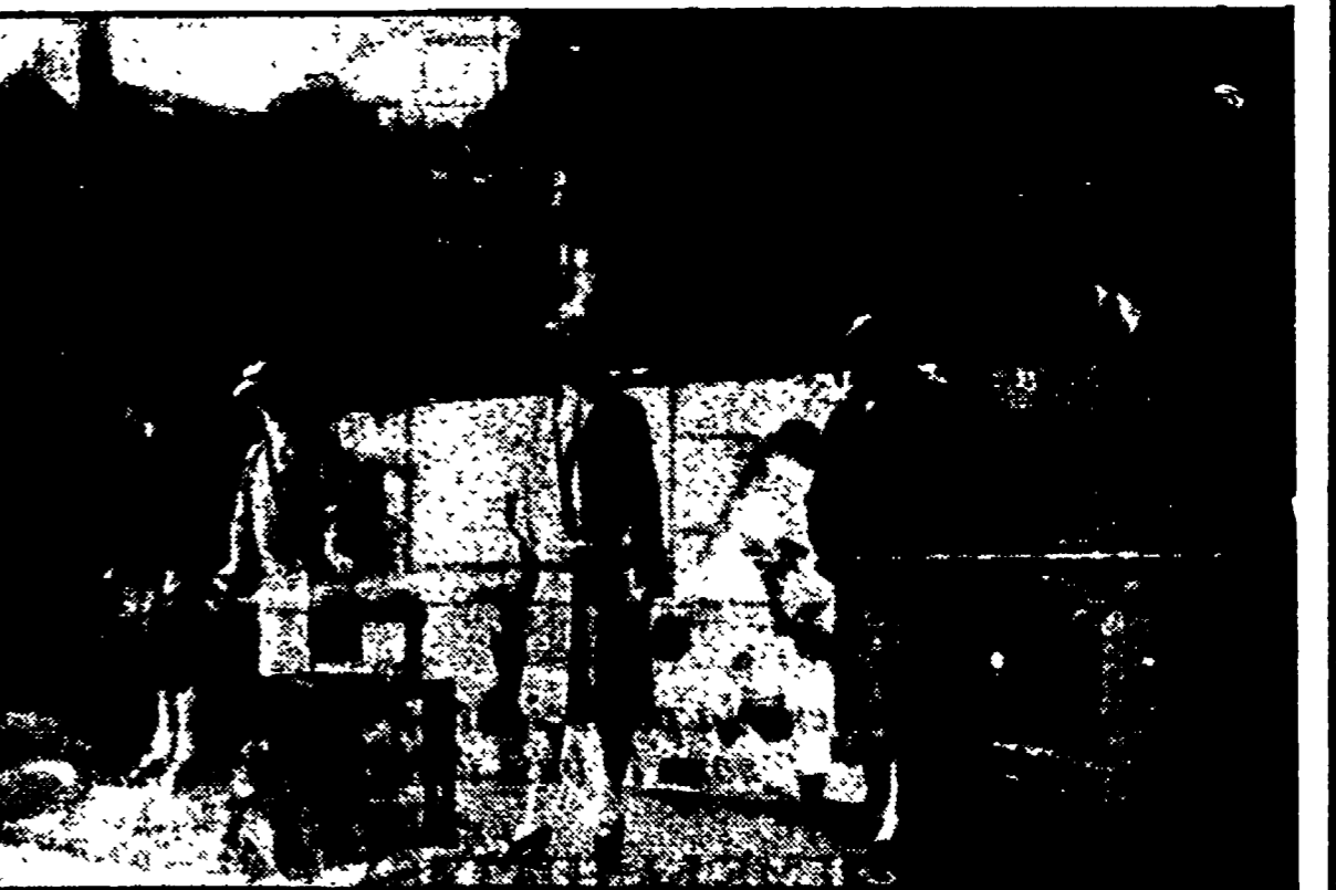
Eugène Atget, foto di una vetrina di Parigi.