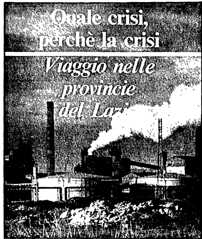
Quale crisi, perché la crisi Viaggio nelle province del Lazio

Se cinquant'anni fa, Latina è nata vincendo l'acqua stagnante della palude, è indubbio che il suo sviluppo è stato segnato dal «fiume» impetuoso dei soldi Casmez che nel corso degli ultimi trent'anni, l'hanno portata ad avere un tessuto industriale non indifferente: 290 impianti e 31.000 addetti. Non esiste un calcolo preciso. «Ed invece — continua Asfoco — i segnali di un processo di delinquenza industriale ci sono tutti. Ammesso e non concesso che 1.600 lavoratori tessili