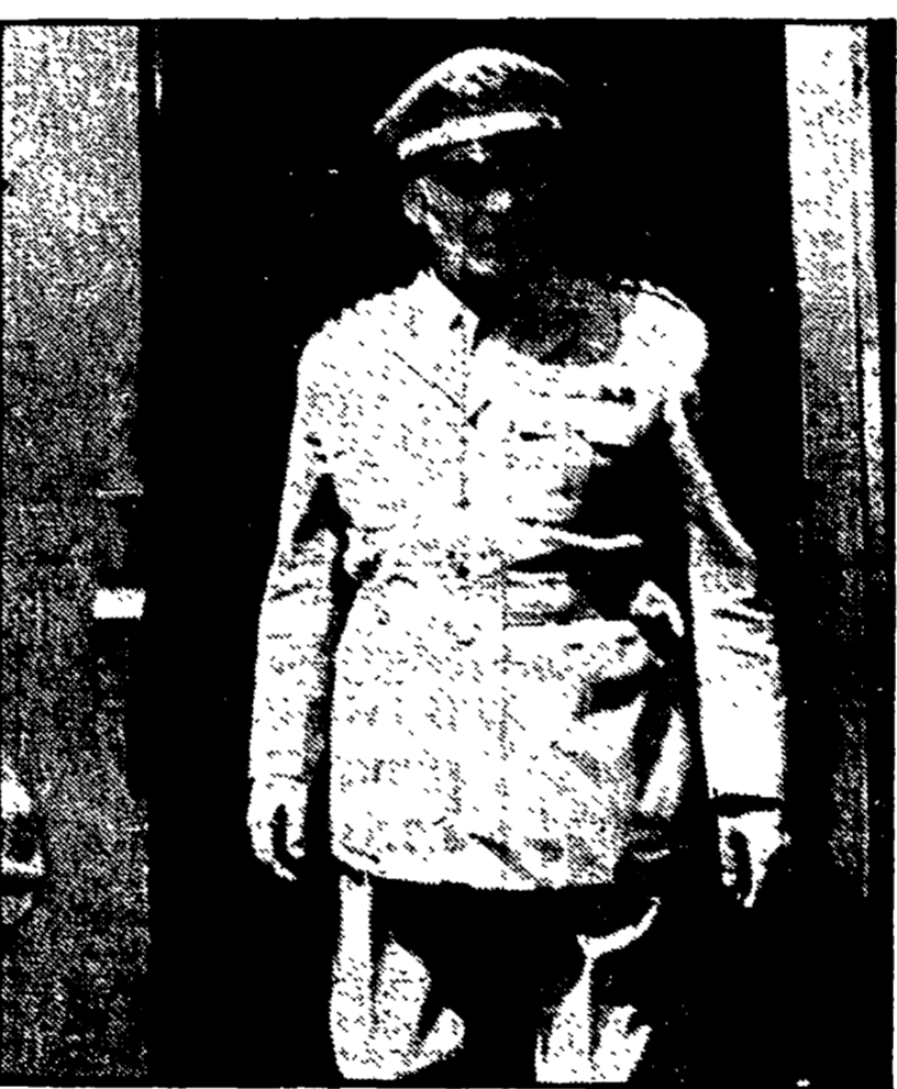
Il generale Raffaele Giudice davanti alla Corte dei Conti