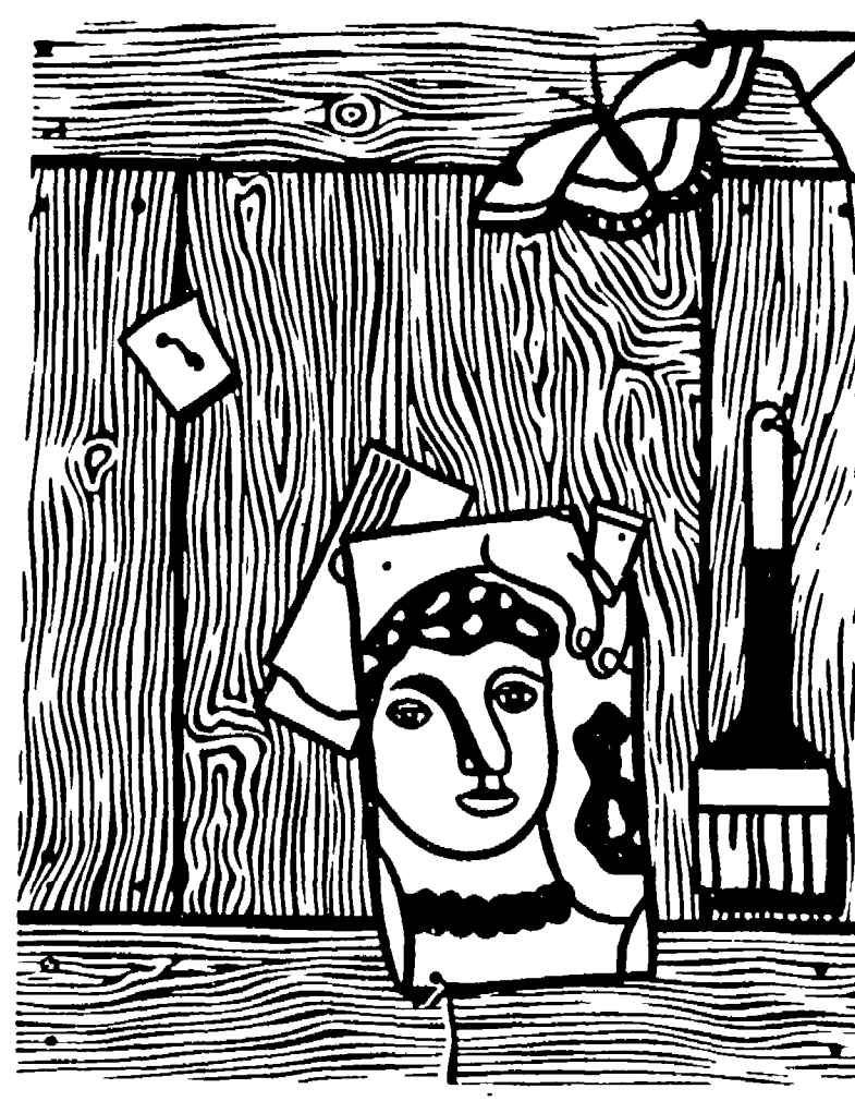
Roy Lichtenstein: «Oeil with Leger Head and Paintbrush», 1970 o 1970