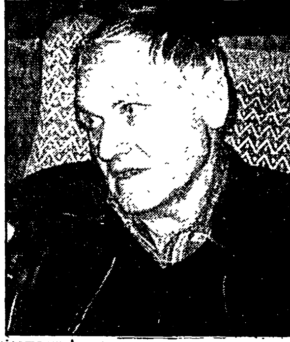
Istvan Szabo e Miklós Jancsó le due stelle del cinema ungherese