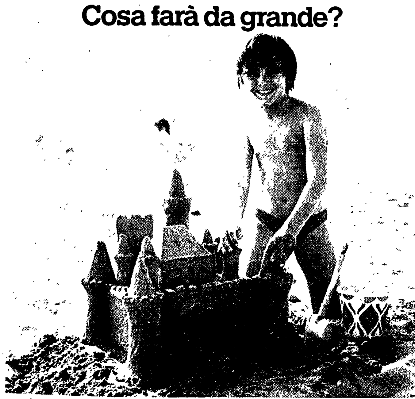
Per aiutare il tuo futuro "architetto" a crescere bene...

NELLE FOTO: Bearzot, con Causio e Antognoni e il presentatore Beppe Grillo, sul palco di Montecatini. Per i nazionali, inoltre, è tempo di breve riposo: Antognoni sulle spiagge della Versilia, Gentile a Varigotti