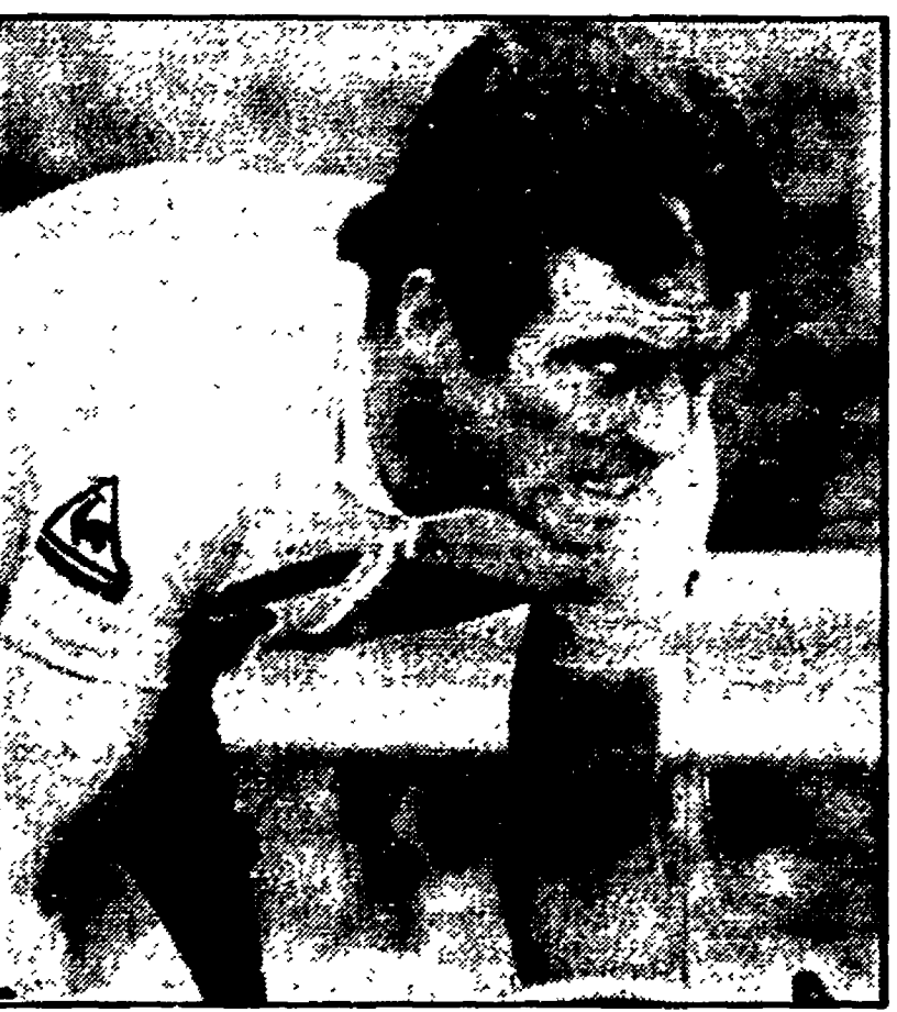
Nella foto BERNARD HINAULT durante la cronometro