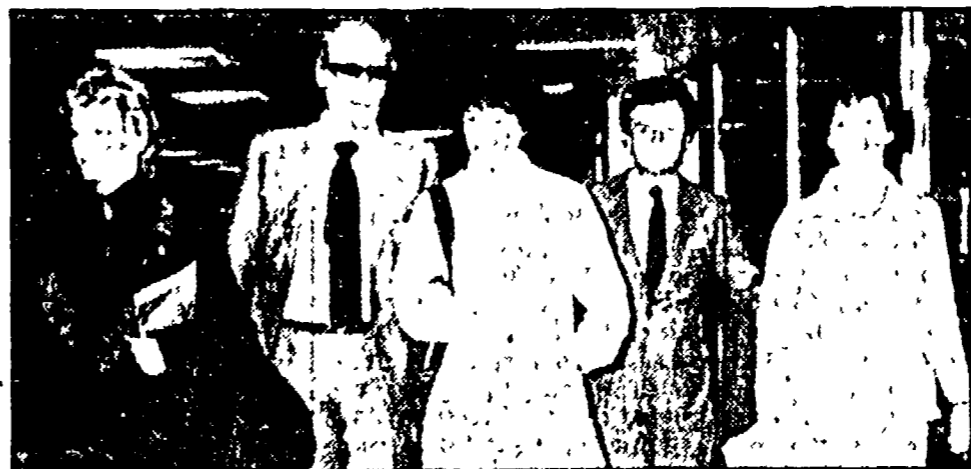
L'arrivo a Londra dei familiari e del figlio della Bergman