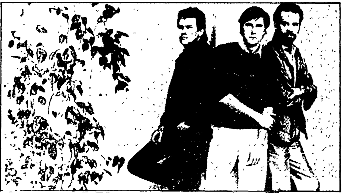
Qui sopra i Roxy Music (al centro Bryan Ferry); nella foto in alto Robert Fripp