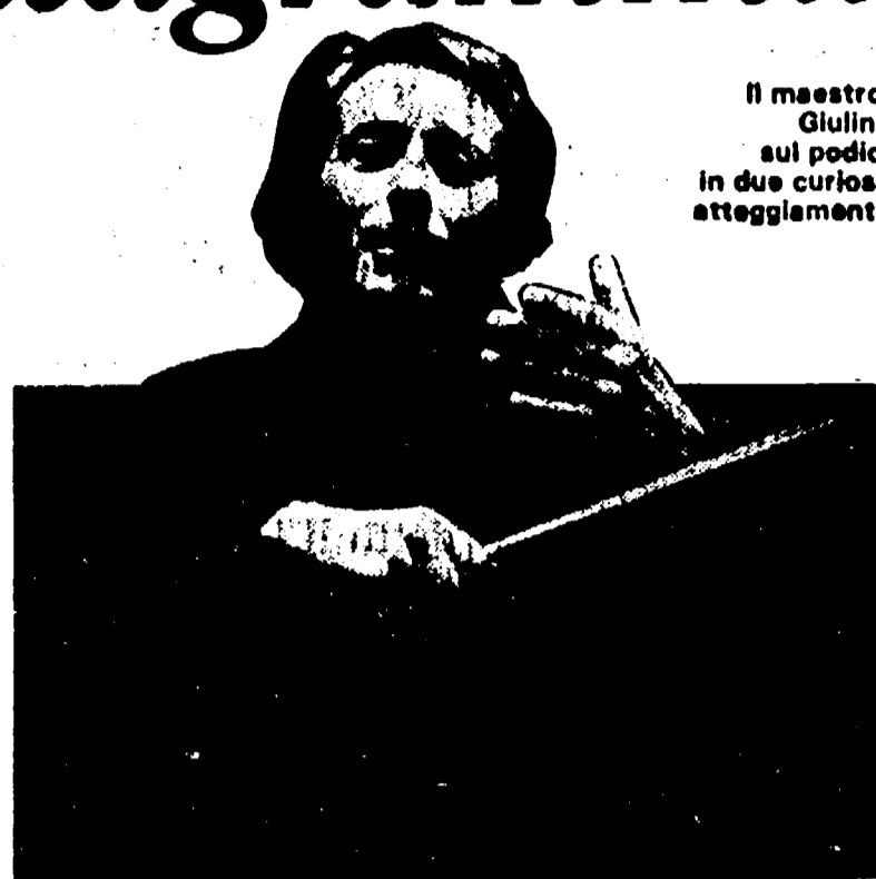
Il maestro Giulini sul podio in due curiosi atteggiamenti