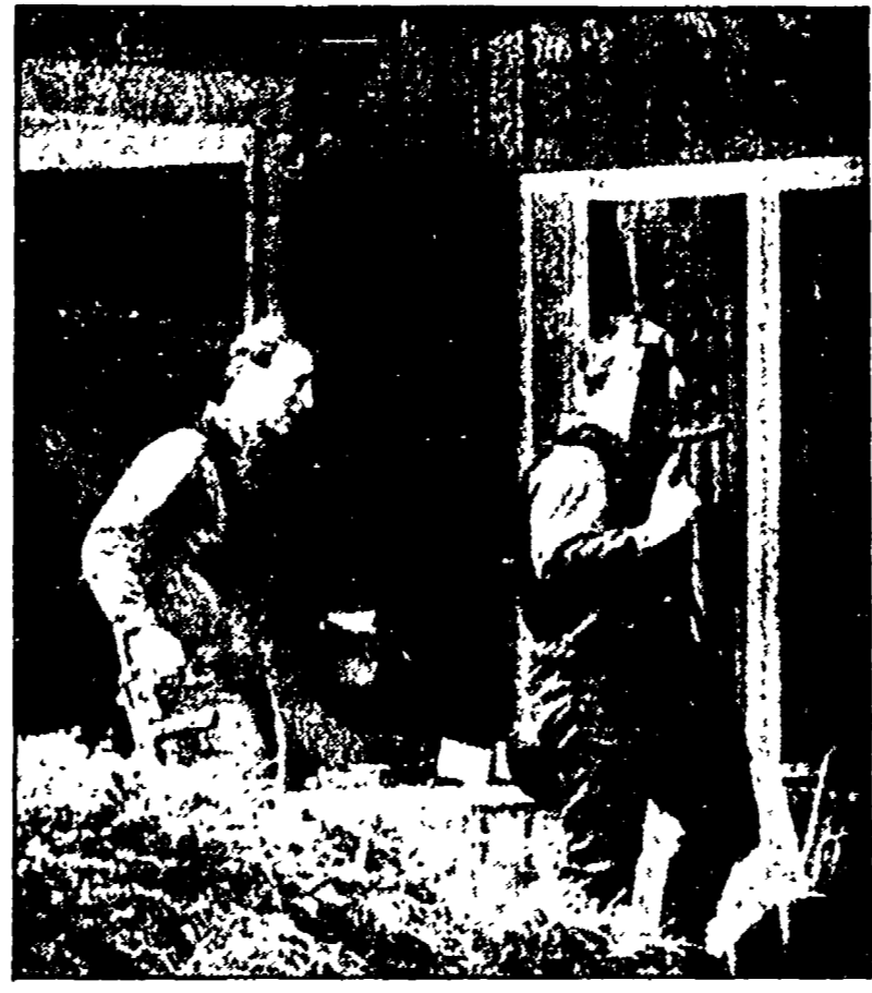
BERNA - Due poliziotti nel giardino dell'ambasciata polacca dopo l'irruzione dei reparti antiterrorismo

(che si era definito colonnello Wyszokki) dal villaggio polacco di Wyszok, dove è nato 42 anni fa...»