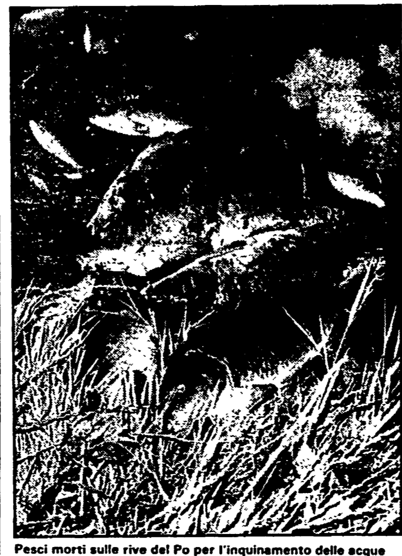
Pesci morti sulle rive del Po per l'inquinamento delle acque

a 18.774. Va detto, per chiarezza, che il fosforo, da studi effettuati dal CNR, è nel 91% del caso in origine minerale...»