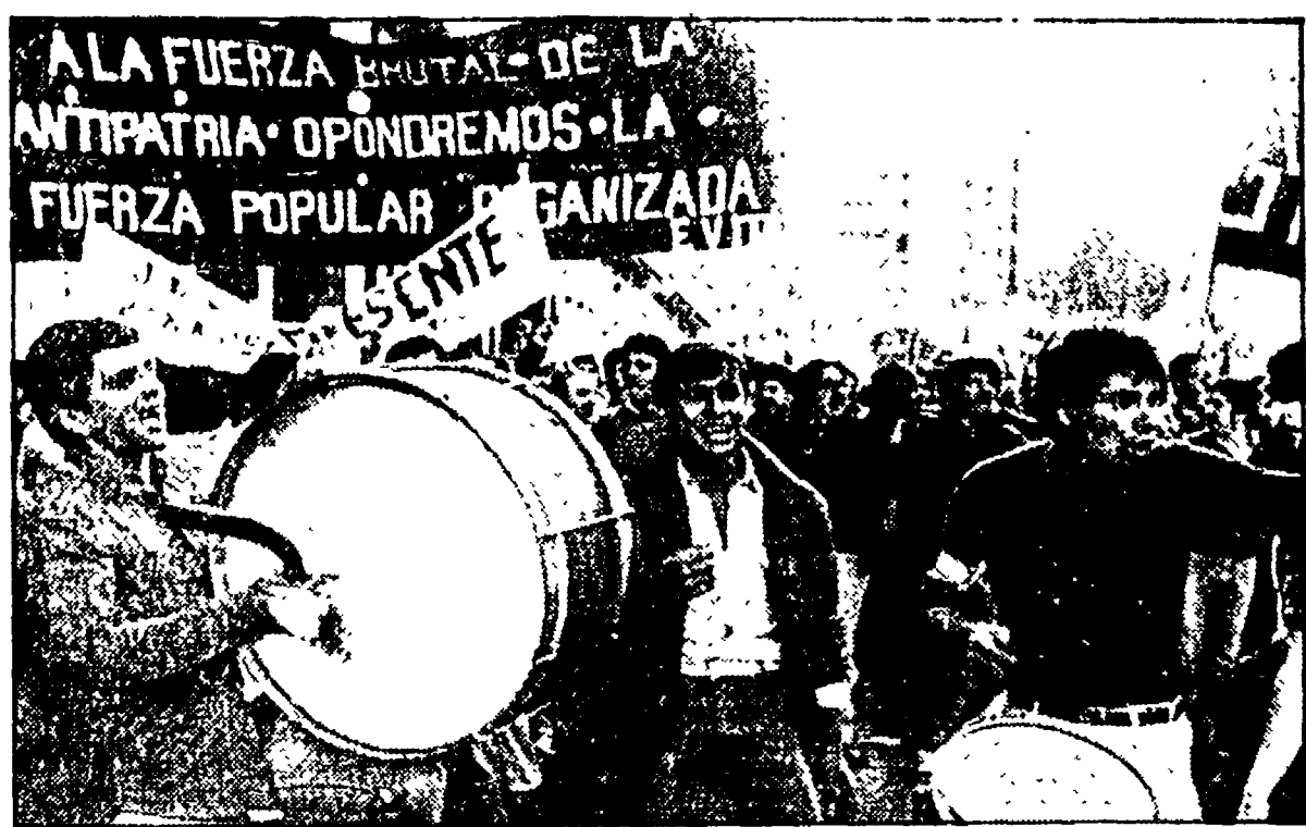
BUENOS AIRES - Un'immagine della folla che ha sfilato contro il regime argentino

La più grande manifestazione d'opposizione al regime dal 1976 - Quattro «generali delle Malvine» chiedono il prepensionamento - Un'autocritica dell'ex presidente Lanusse