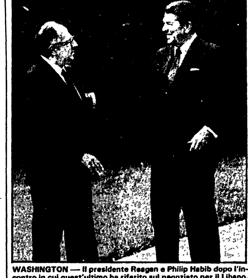
WASHINGTON — Il presidente Reagan e Philip Habib dopo l'incontro in cui quest'ultimo ha riferito sul negoziato per il Libano.