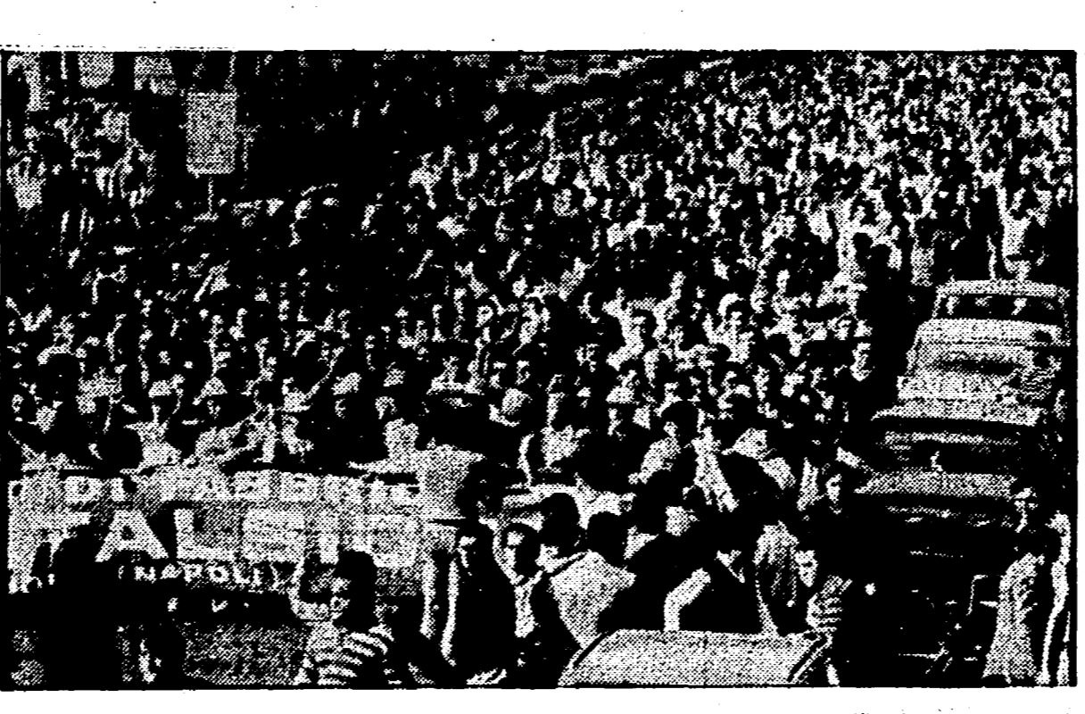
MILANO — La manifestazione degli studenti

ROMA — Ad una svolta forse clamorosa le indagini sull'attentato al Papa del 13 maggio 1981. Le autorità svizzere hanno informato l'Italia che il cittadino turco Omer Bagci sarebbe lui l'uomo che quattro giorni prima dell'attentato in piazza S. Pietro formò la pistola usata dal connazionale Ali Agca.