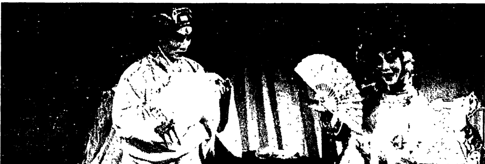
In scena a Venezia l'Opera di Suzhou: straordinari artisti resuscitano favole e acrobazie molto antiche. Ma per noi non è un'arte così lontana. Il teatro popolare ha le stesse radici in Asia e in Europa