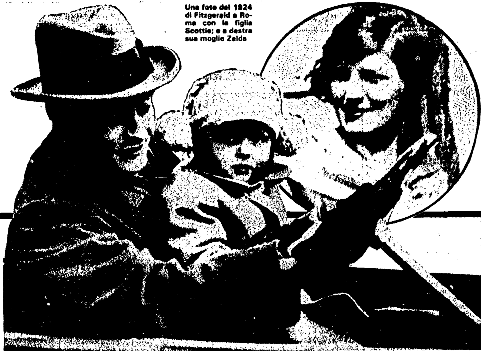
Una foto del 1924 di Fitzgerald e Roma con la figlia Scottie; e a destra sua moglie Zelda

Seconda raccolta dei «racconti commerciali» del grande scrittore: furono «fabbricati» durante la Crisi solo per soldi. Ma con grande arte