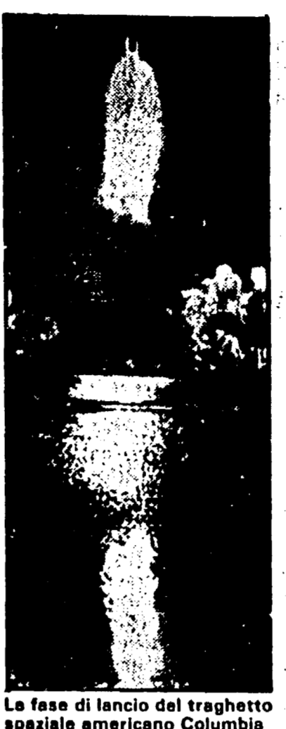
La fase di lancio del traghetto spaziale americano Columbia