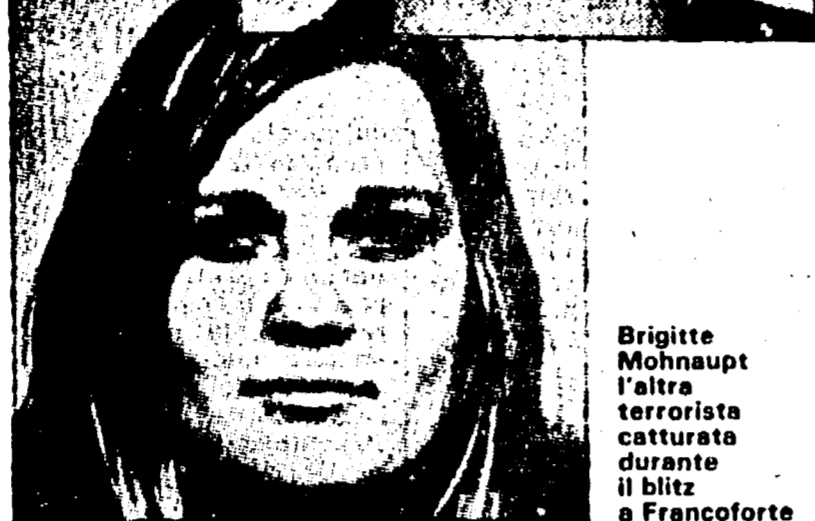
Brigitta Mohnhaupt l'altra terrorista curata dal blitz a Francoforte