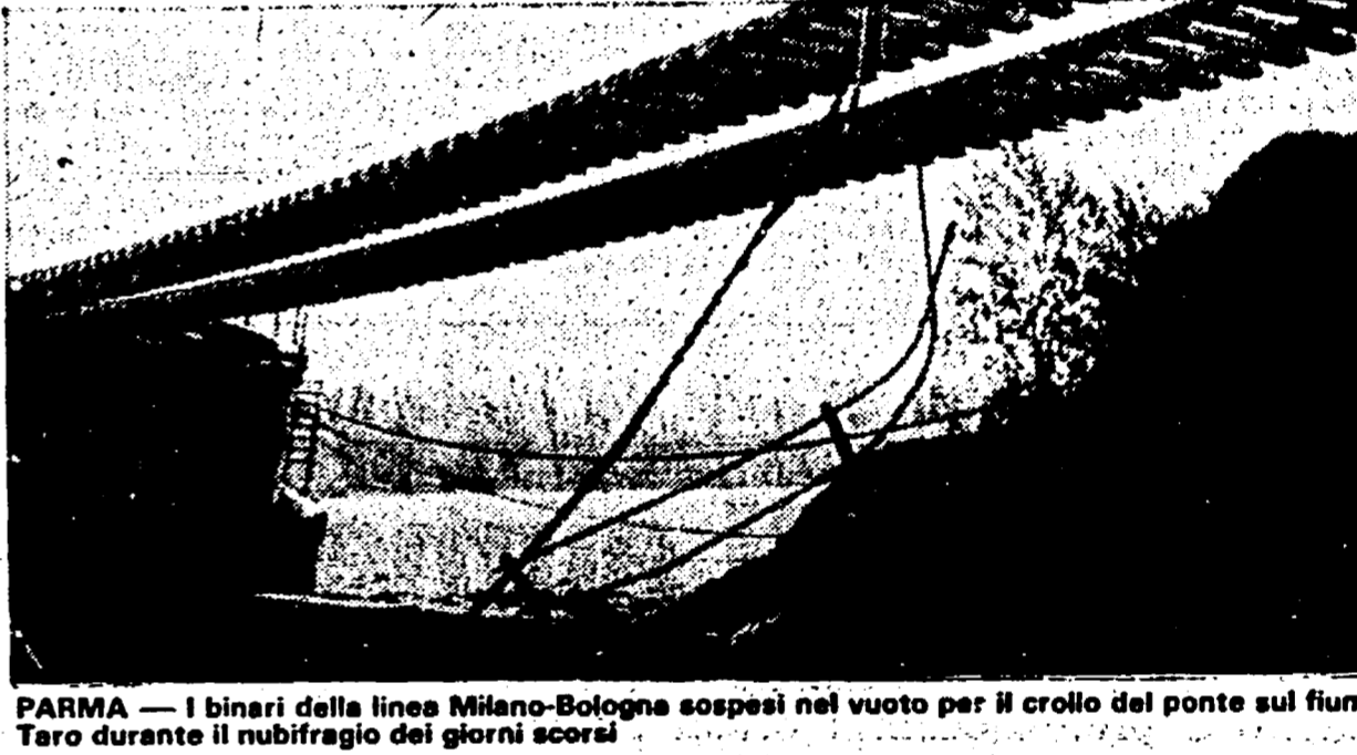
PARMA — I binari della linea Milano-Bologna sospesi nel vuoto per il crollo del ponte sul fiume Taro durante il nubifragio dei giorni scorsi

La piena del Taro ha distrutto il ponte: necessario ricostruire il viadotto - Per il ripristino provvisorio occorreranno 35 giorni