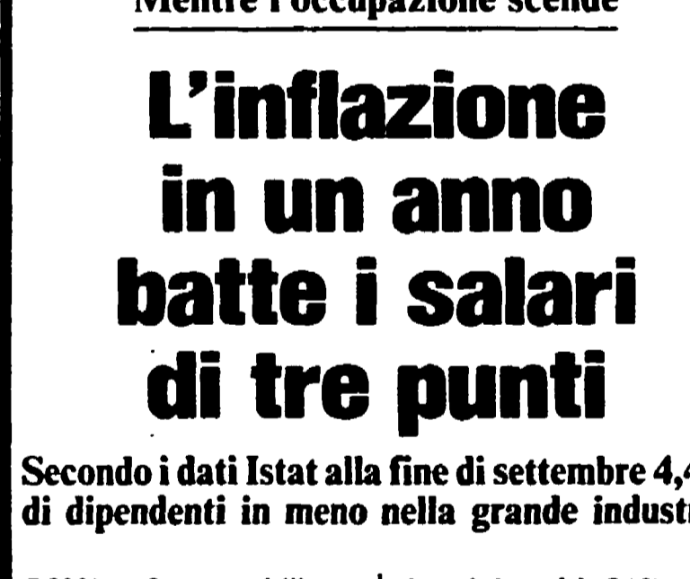
Secondo i dati Istat alla fine di settembre 4,4% di dipendenti in meno nella grande industria