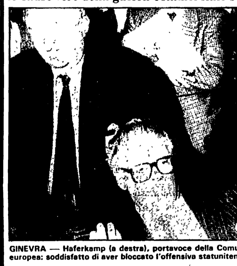
GINEVRA - Haferkamp (a destra), portavoce della Comunità europea: soddisfatta di aver bloccato l'offensiva statunitense

Un attacco di Nesi a Schlesinger. Si riapre lo scontro tra DC e PSI sulle sorti del Corriere e del gruppo Rizzoli. MILANO - È di nuovo scontro aperto e duro sulle sorti e il controllo del «Corriere della Sera» e del gruppo Rizzoli.