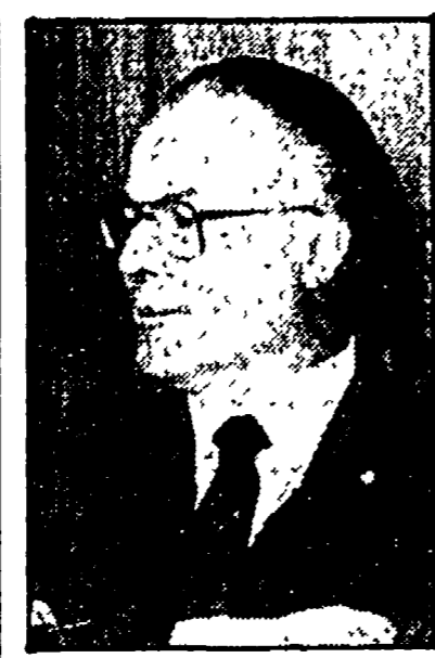
Il generale Vittorio Santini