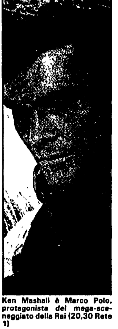
Ken Marshall è Marco Polo, protagonista della mega-sceneggiato della Rai (20,30 Rete 1)