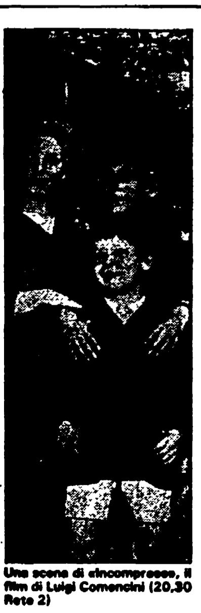
Una scena di «Incompreso», film di Luigi Comencini (20,30 Rete 2)