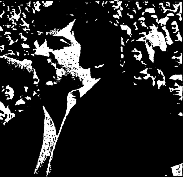
Gerardo Iglesias, segretario generale del PCE