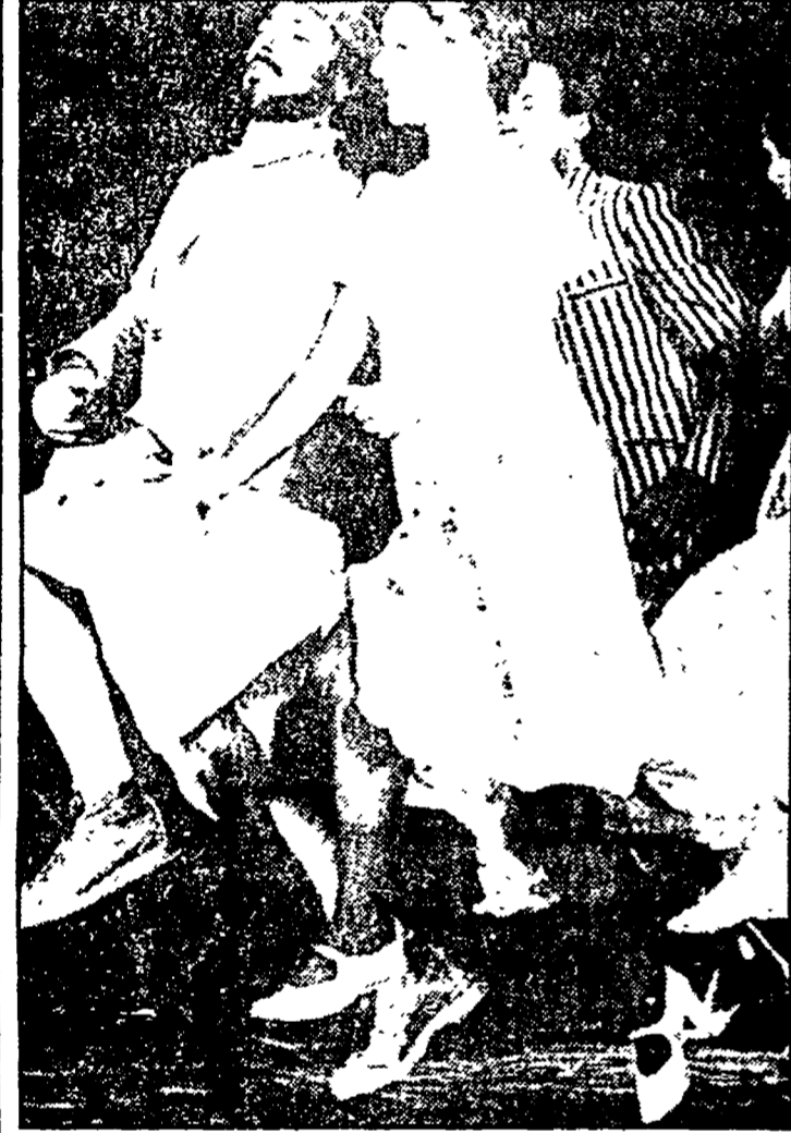
Una scena del «Formaggio pericoloso» dei Crownsnest

GENOVA - Tecnicamente ineccepibili, colti, ironici e «chici», i danzatori-coreografi americani del Crownsnest (letteralmente «Nido di corvo») sono ritornati in Italia dopo un anno di assenza per una breve tournée che, tra l'altro, ha inaugurato la seconda rassegna di Teatro Danza al Teatro Alceone promossa dalla Giovane Orchestra Genovese e dal Teatro della Tosse.