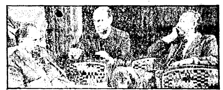
«Quartetto Basileus» (Rete 2, ore 21.35)