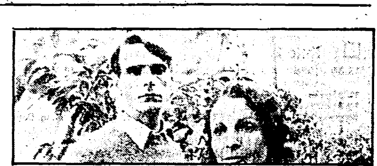
«Ritorno a Brideshead» (Rete 2, ore 20.30)