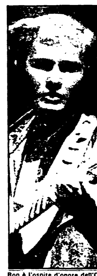
Ronald Reagan è l'ospite d'onore dell'«Orechocchio» (Rete 3, ore 18,30)