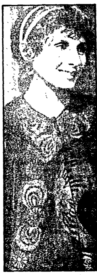
Paola Pitagorè in «Tre anni» (Rete 1, ore 20,30)