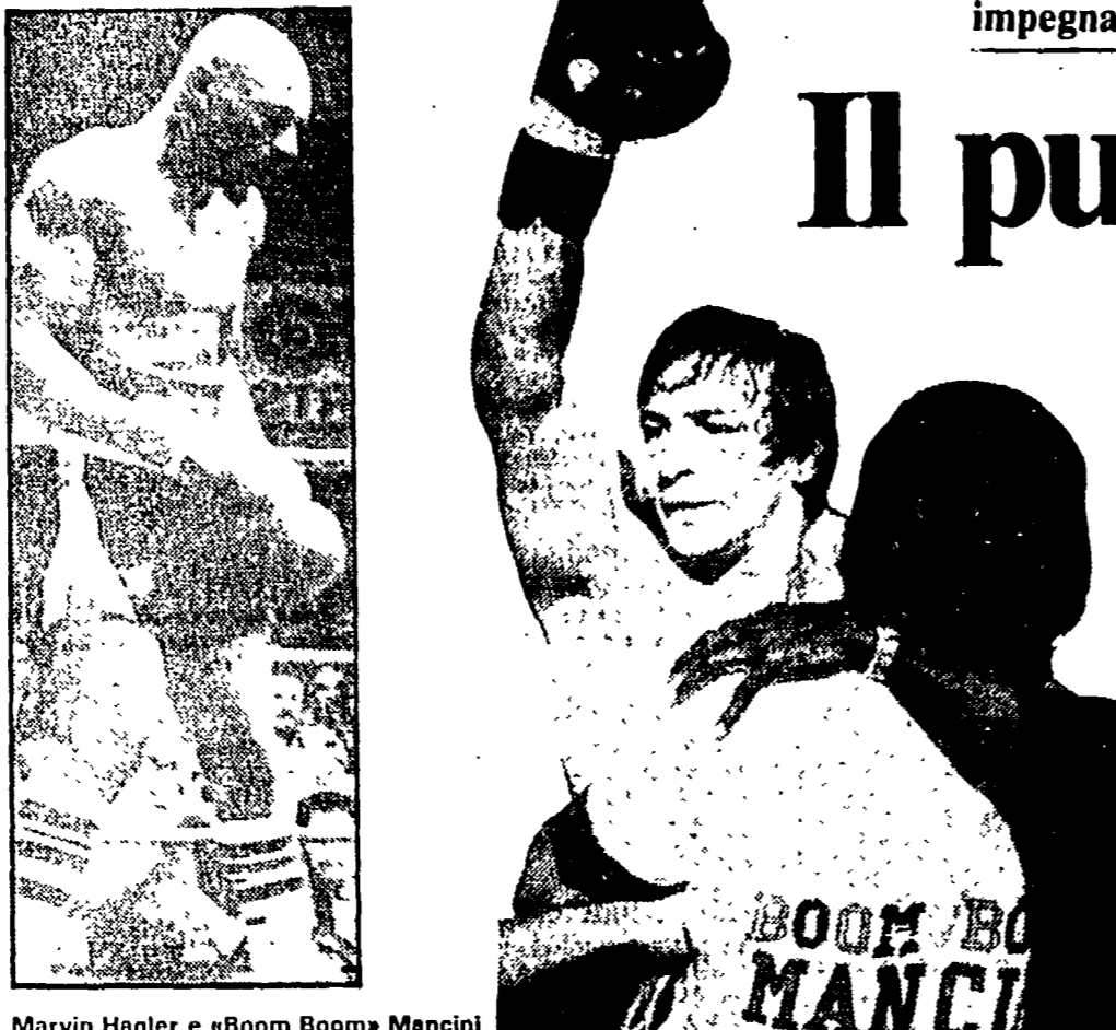
Marvin Hagler e «Boom Boom» Mancini