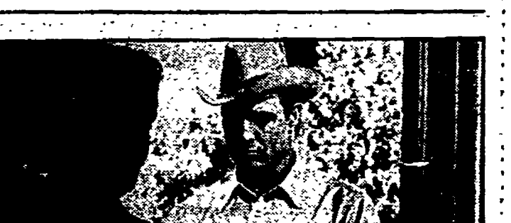
Marlon Brando in «La caccia» (rete 1 ore 20,30)