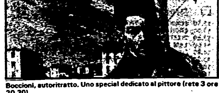
Boccioni, autoritratto. Uno special dedicato al pittore (rete 3 ore 20,30)