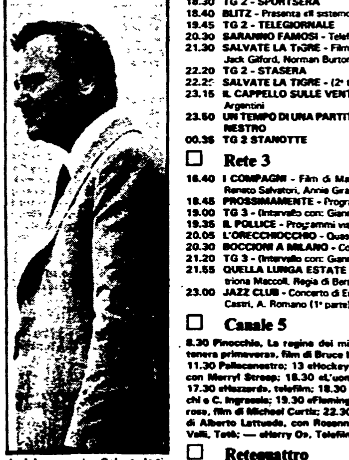
Jack Lemmon in «Salvate la Tigre» (rete 2 ore 21,30)

Rete 1 10.00 L'ALTRO SIMERON - Il signor Carduano di Georges Simenon, Con: Dario Mazzo, Giancarlo Taccuola, Jole Semer 11.10 ALFA: ALLA RICERCA DELL'UOMO - Oltre le spianze. Un'inchiesta di G. Poli ed E. Senne 12.15 SERZA, CONTRATTO - A cura di Giorgio Pettrini 12.30 CHECK-UP - Un programma di medicina 13.25 CHE TEMPO FA 13.30 TELEGIORNALE 14.00 PRISMA - Settimanale di variati e spettacolo 14.30 SABATO SPORTY - Rugby: Scozia-Galles 17.00 TG1 - FLASH 17.05 PROSSIMAMENTE - Programmi per sette sera 17.20 I PROBLEMI DEL SIGNOR ROSSI - Cartina di tornante della famiglia italiana