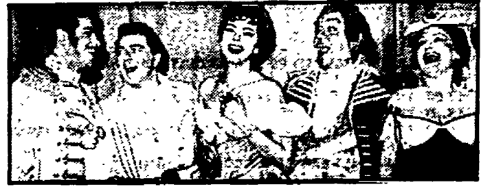
Ferruccio Tagliavini (secondo da sinistra) e ai grandi della lirica (rete 2 ore 23,05)