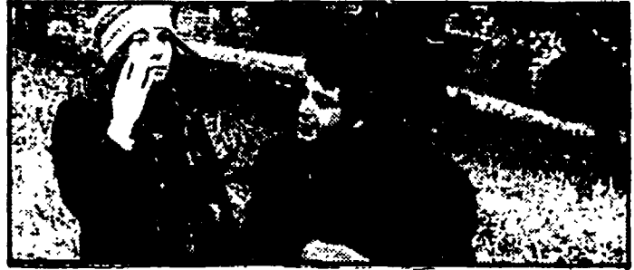
Panico e Neddle Park (rete 3 ore 20,30)