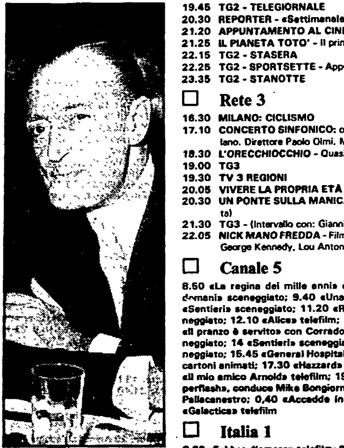
Alberto Sordi e Monicelli, protagonisti e regista di «Un borghese piccolo piccolo» (rete 1 ore 20,30)

Rete 1 12.30 LE SETTE MERAVIGLIE DEL MONDO - (1ª puntata) «Le piramidi d'Egitto» 13.00 CRONACHE ITALIANE - Cronache dei motori 13.30 TELEGIORNALE 14.00 AL PARADISE - con Milva, Heather Parisi e Orsino Colonna. Regia di Antonello Falqui