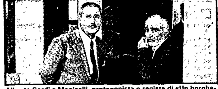
Alberto Sordi e Monicelli, protagonisti e regista di «Un borghese piccolo piccolo» (rete 1 ore 20,30)