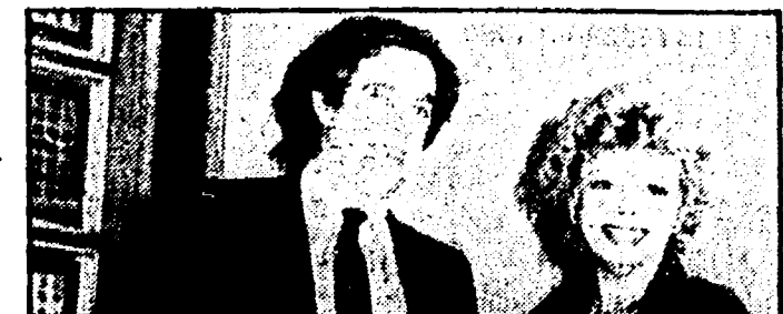
Minoli e Milo in «Miserere» (Rete 2, ore 20,30)