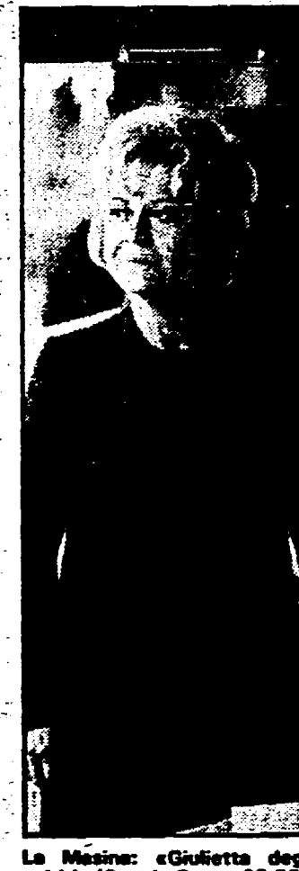
La Miesina in «Giuletta degli spiriti» (Canale 5, ore 23,30)