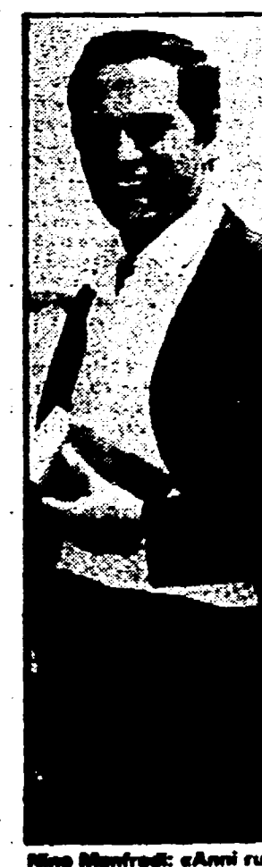
Nino Manfredi: «Agni ruggine» (Retequattro, 21.11.2000)