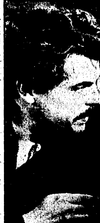
Michele Placido in «Fantasma» (Rete 1, ore 21,35)