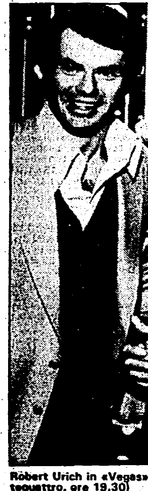
Robert Ulrich in «Vegas» (Retequattro, ore 19,30)