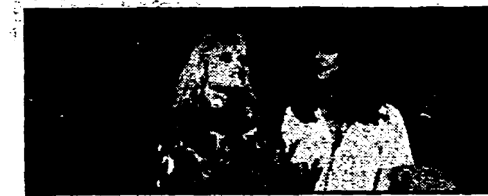
Heather Parisi e Milva: «Al Paradiso» (Rete 1, ore 20,30)