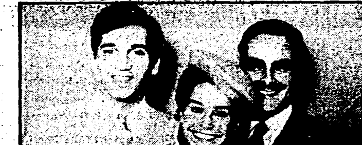
Heather Parisi e Milva: «Al Paradiso» (Rete 1, ore 20,30)