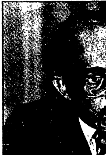
Marcelino Dos Santos

realità. Ma nello stesso tempo dobbiamo fare tutto perché queste voci non si materializzino. Per questo vogliamo ricordare non una, ma due e molte volte questa semplice verità: l'apartheid è un crimine contro l'umanità.