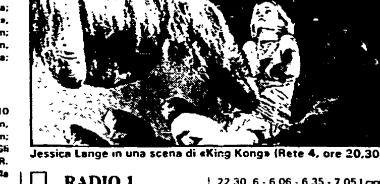
Jessica Lange in una scena di «King Kong» (Rete 4, ore 20,30)