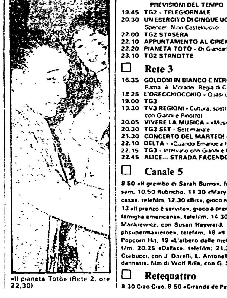
«Il pianeta Totò» (Rete 2, ore 22,30)