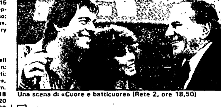
Una scena di «Cuore e batticuore» (Rete 2, ore 18,50)